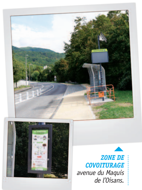
ZONE DE COVOITURAGE avenue du Maquis de l'Oisans.

La zone de covoiturage est pourvue d'un panneau lumineux "Covoit'pouce" et d'un espace permettant aux voitures de se stationner temporairement. L'utilisation du panneau est très simple : le passager souhaitant covoiturer, choisit sur le boîtier du panneau la destination vers laquelle il souhaite se rendre. Celle-ci s'affiche alors sur l'écran, permettant aux automobilistes de prendre connaissance de la destination souhaitée, de façon très visible, même la nuit. Ils peuvent alors s'arrêter sur l'aire de stationnement pour prendre les personnes souhaitant covoiturer. L'utilisation est gratuite, sans inscription, et fonctionne à tout moment du jour ou de la nuit.