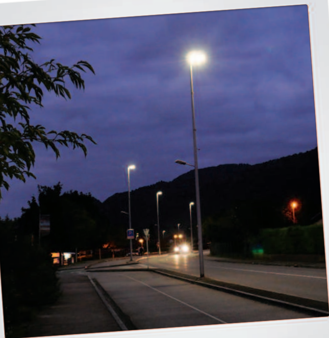
RUE PIERRE MENDÈS FRANCE, en direction de Poizat, une partie de l'éclairage public est déjà équipée de leds.

“Le flux lumineux est aujourd’hui orienté vers le sol au lieu d’éclairer inutilement les arbres.”