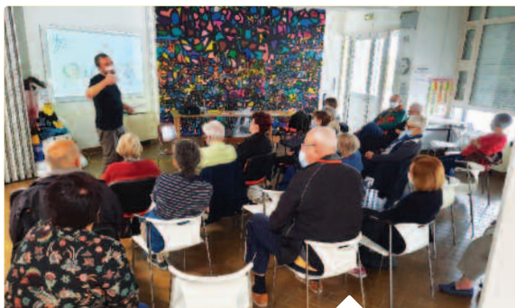
CONFÉRENCE SUR LA PRÉVENTION DES CHUTES avant le lancement des ateliers "Âge'ilité".

Après une édition 2020 annulée à cause du contexte sanitaire, les aînés ont eu enfin le plaisir de se retrouver autour de plusieurs temps conviviaux.