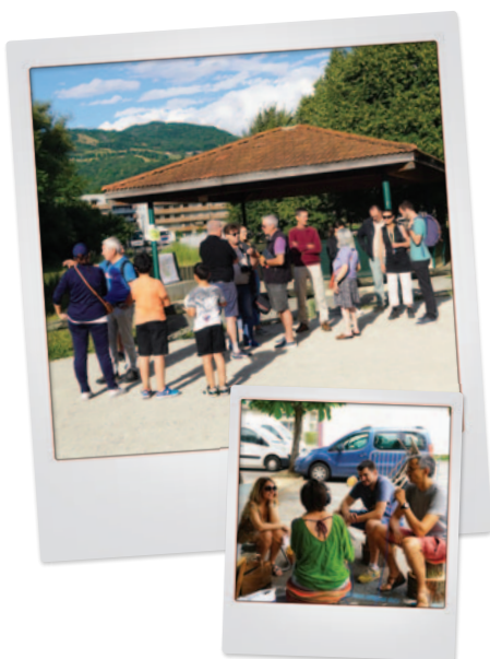
LA CONCERTATION ET LA PARTICIPATION CITOYENNE font partie intégrante des projets d'aménagement à venir.

La municipalité et Grenoble-Alpes Métropole engagent plusieurs projets d'aménagement sur le territoire communal afin d'améliorer le cadre de vie de chacun. Découvrez dans ce dossier les principaux projets d'aménagement qui seront réalisés à Eybens dans les années à venir.