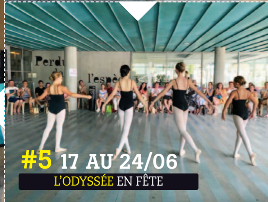
#5 17 AU 24/06 L'ODYSSÉE EN FÊTE