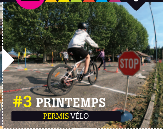
#3 PRINTEMPS PERMIS VÉLO