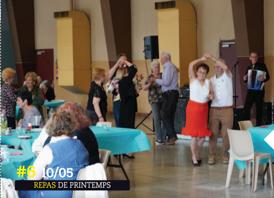
#6 10/05 REPAS DE PRINTEMPS