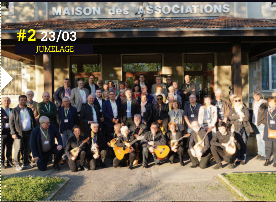
#2 23/03 JUMELAGE