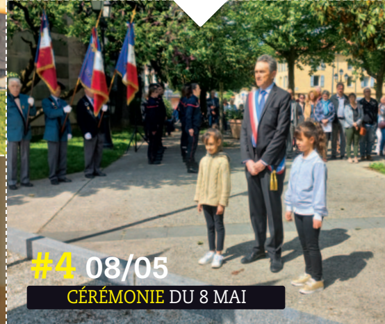
#4 08/05 CÉRÉMONIE DU 8 MAI