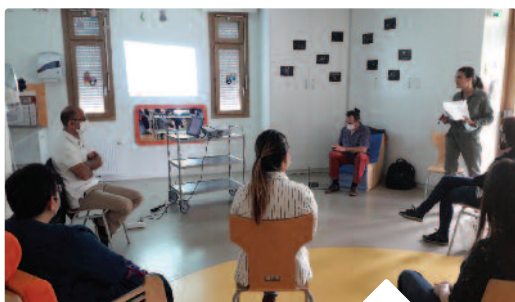
FORMATION PAR LA CELLULE COVID DU CHU du personnel petite enfance de la Ville.

Les services petite enfance et scolaire reprennent progressivement leurs activités en accueillant les enfants dans le respect très strict des protocoles sanitaires : nettoyage des locaux, réaménagement des espaces, condamnation des jeux extérieurs, ajustement d'effectifs... Tout est mis en place pour que cette deuxième rentrée inédite se passe bien.