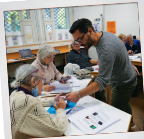
DES ATELIERS NUMÉRIQUES à destination des seniors sont organisés régulièrement dans les Maisons des habitants.

NOMBRE DE PERSONNES AGÉES DE PLUS DE 75 ANS entre 2007 et 2017.