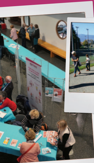
ORGANISÉE LES 4 ET 5 OCTOBRE À EYBENS, cette année "Changeons de regards sur nos idées reçues"