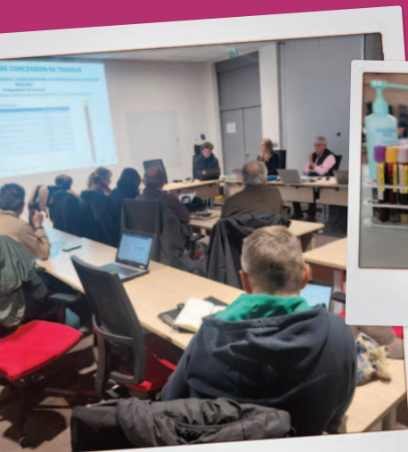
RÉUNION PLÉNIÈRE SUR LE PROJET DE MAISON DE SANTÉ PLURIPROFESSIONNELLE en janvier 2024.