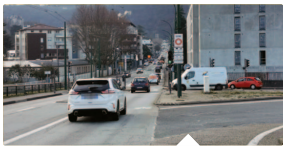
EYBENS FAIT PARTIE DES 13 COMMUNES DE LA MÉTROPOLITAINE concernées par la ZFE.

Depuis le 1 er janvier, la circulation des voitures et deux roues motorisés de catégorie Crit'Air 4 est interdite dans 13 communes de Grenoble Alpes Métropole, du lundi au vendredi de 7h à 19h.