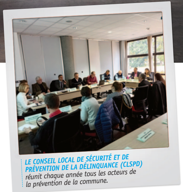
LE CONSEIL LOCAL DE SÉCURITÉ ET DE PRÉVENTION DE LA DÉLINQUANCE (CLSPD) réunit chaque année tous les acteurs de la prévention de la commune.